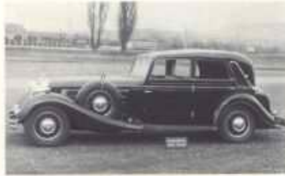
1936 Horch 853