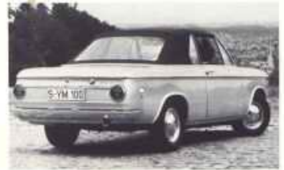
1968 BMW 1600/2002