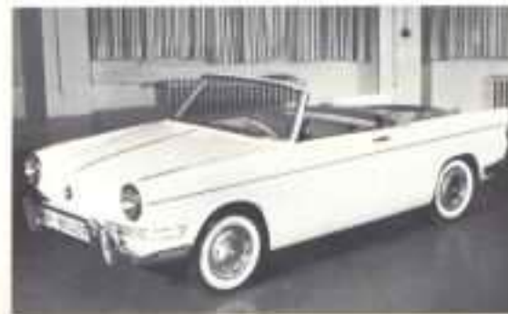
1964 BMW 700