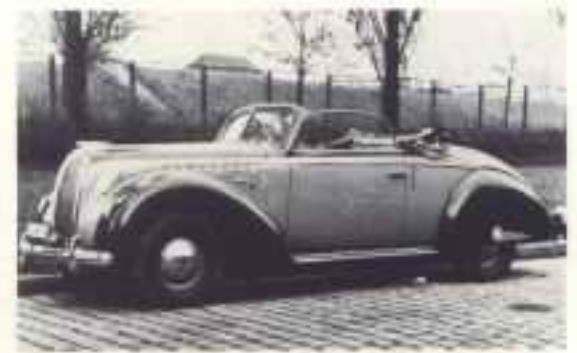
1939 Opel Admiral