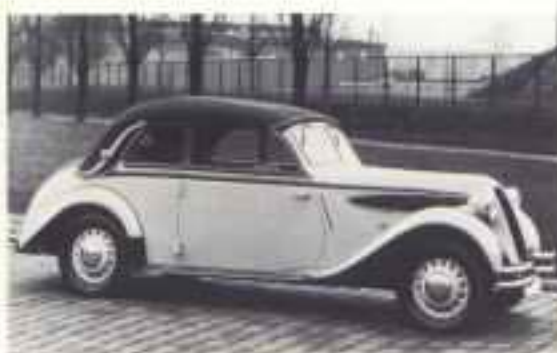
1937 BMW 326 4-sitzig