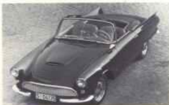
1961 Auto-Union 1000 SP