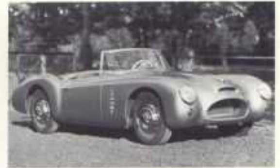
1956 BMW Sportwagen Studie