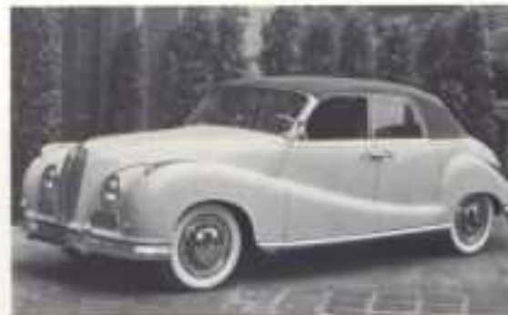
1955 BMW 502