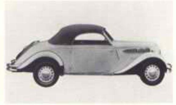
1937 BMW 326 2-sitzig