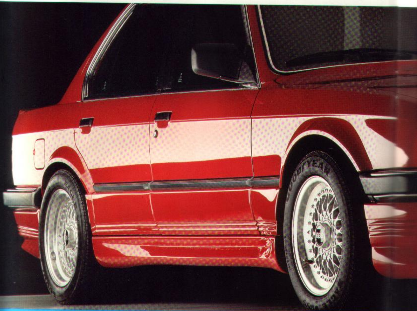
BMW 3/1 à partir de 9/85