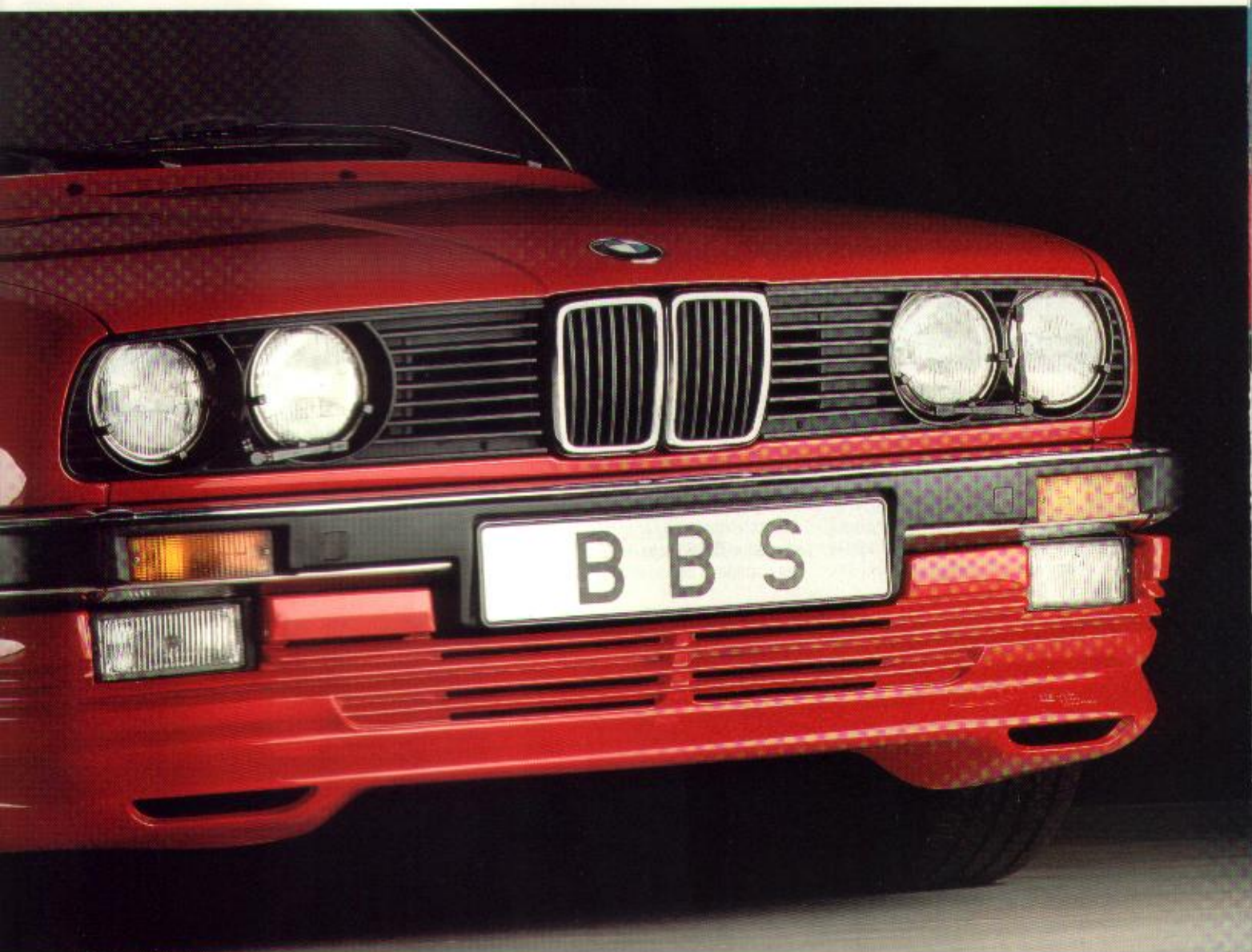
BMW 325i - Groupe A - Championnat d'Europe des voitures de tourisme '86 - Division 2